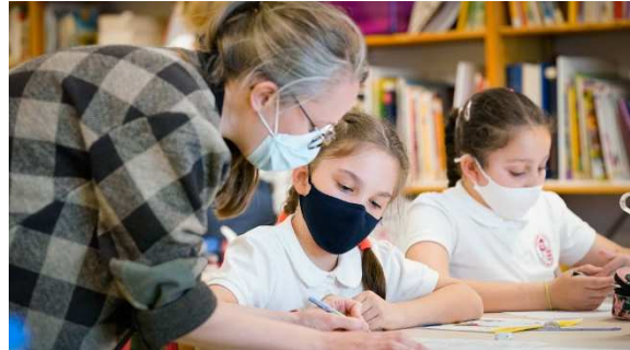
Le Bestiaire Dessiné , Résidence en milieu scolaire d'Orianne Lassus, 2021

La publication intitulée Le Bestiaire Dessiné est l'aboutissement de cette résidence en milieu scolaire conçue en partenariat avec la Direction de l'Éducation nationale, de la Jeunesse et des Sports et recevant le soutien du Gouvernement Princier. L'ouvrage, tiré à 400 exemplaires, a été gratuitement distribué à tous les élèves, enseignants et directrices des écoles primaires participantes.