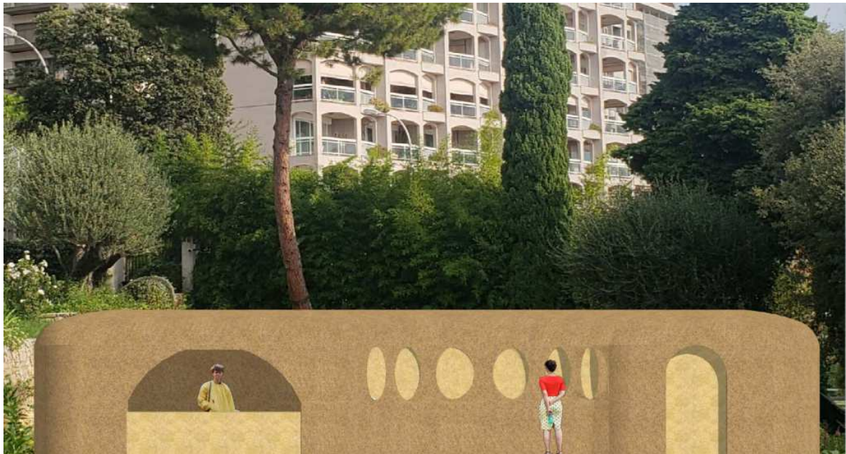
Guillaume Aubry, projet de café de la Villa Paloma

Inspiré par ses recherches et créations autour du soleil et reprenant le dessin originel du jardin de la Villa, il a pensé un projet total. Entièrement construit en pisé (terre crue), le café sera aussi respectueux de l'environnement dans son approche architecturale (recyclage de matériaux de constructions, phytoépuration) que dans le cahier des charges d'exploitation (produits locaux issus de l'agriculture biologique). Orientée plein sud, la contre-courbe jalonnée de fours solaires confère à la structure sa dimension sculpturale.